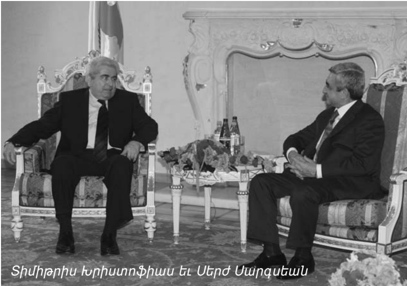
Տիմիթրիու Խրիստոֆիաս եւ Սերժ Սարգսեան

Երկուշաբթի, 6 Յուլիս եւ Երեքշաբթի, 7 Յուլիս 2009ին, Կիպրոսի Հանրապետութեան Նախագահ Ն.Վ.