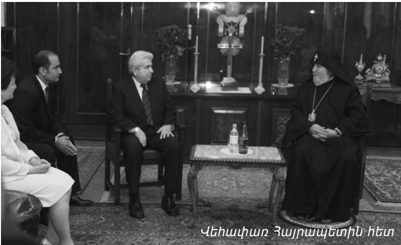
Վեհափառ Հայրապետին հետ

Նախագահ Խրիստոֆիաս, Հայաստան ժամանած օրը, տեսակցեցաւ Ն.Ս.Օ.Տ.Տ. Գարեգին Բ. Ամենայն Հայոց Կաթողիկոսին հետ, ապա անոր գլխաւորած պատուիրակութեան հետ, այցելեց Ս. Էջմիածնի Սայր Տա-