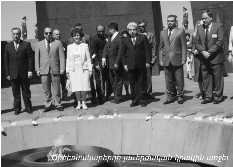
Ծիծեռնակաբերդի յաւերժական կրակին առջեւ

Տիմոթիու Խրիստոֆիաս այցելեց Հայաստան: Հանրապետության Նախագահին հրավերով, որպես Կիպրահայ Համայնքի Պետական Ներկայացուցիչ, Պրն. Վարդգես Մահտեսեան մաս կազմեց Նախագահին ընկերակցող պատուիրակության այս երկօրեայ այցելության ընթացքին: