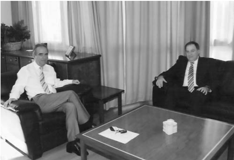
Արդարադատության Նախարար Լուկաս Լուկային հետ

Երեքշաբթի, 22 Սեպտեմբեր 2009ին, Պետական Ներկայացուցիչը հանդիպում մը ունեցաւ, ԱԶԷԼ Կուսակցութեան Եւրոխորհրդարանի երեսփոխաններ Կիրիակոս Թրիանտաֆիլիտիսին եւ Թակիս Յաճիեորդիուին հետ, վերջիններուս խնդրանքով, Կիպրահայ գաղութը յուզող հարցերու շուրջ: