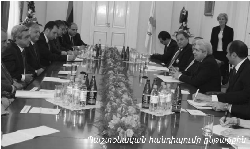
Պաշտօնական հանդիպումի ընթացքին